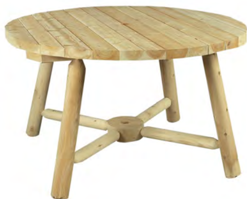
TABLE RONDE POUR PARASOL : 4 À 5 PERSONNES

Poids : 30 Kg Dimensions : 100 x 100 x 14 cm