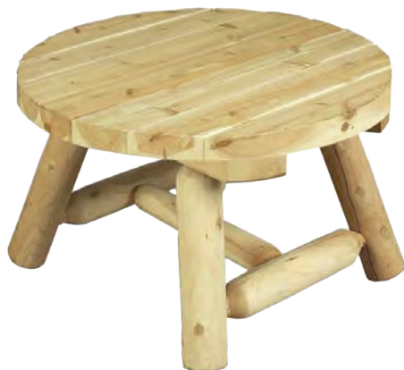
TABLE BASSE RONDE 69 CM