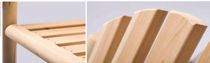
Assise et dossier sablés : finition lisse.

Accoudoir aplani sur le dessus pour plus de confort et sablé : finition lisse.