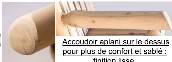
Exemple de fente.

Accoudoir aplani sur le dessus pour plus de confort et sablé : finition lisse.