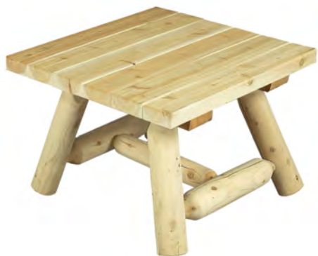
TABLE BASSE CARRÉE

Poids : 4,8 Kg Dimensions : 64 x 41 x 9 cm