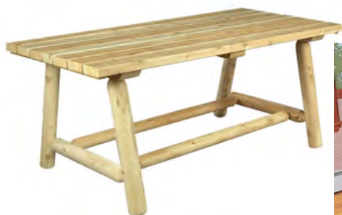
TABLE RECTANGULAIRE POUR 6 À 8 PERSONNES