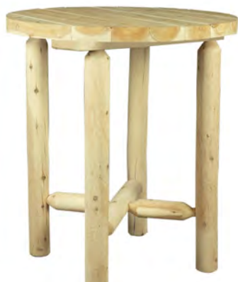
TABLE DE BAR - MANGE DEBOUT 107 CM

Poids : 22,8 Kg Dimensions : 100 x 100 x 14 cm