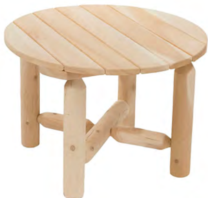
TABLE BASSE RONDE 58

Poids : 18,7 Kg Dimensions : 123 x 63 x 15 cm