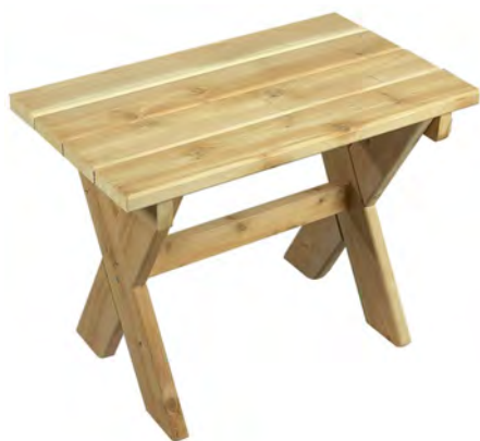
TABLE BASSE ADIRONDACK RECTANGLE