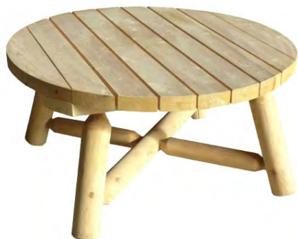
TABLE BASSE RONDE 92 CM

Poids : 12,8 Kg Dimensions : 73 x 71 x 15 cm