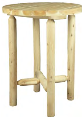
TABLE DE BAR - MANGE DEBOUT 82 CM