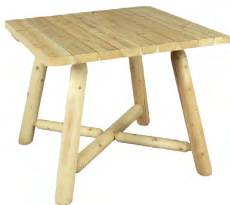
TABLE CARRÉE POUR 4 PERSONNES