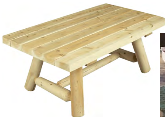
TABLE BASSE RECTANGULAIRE